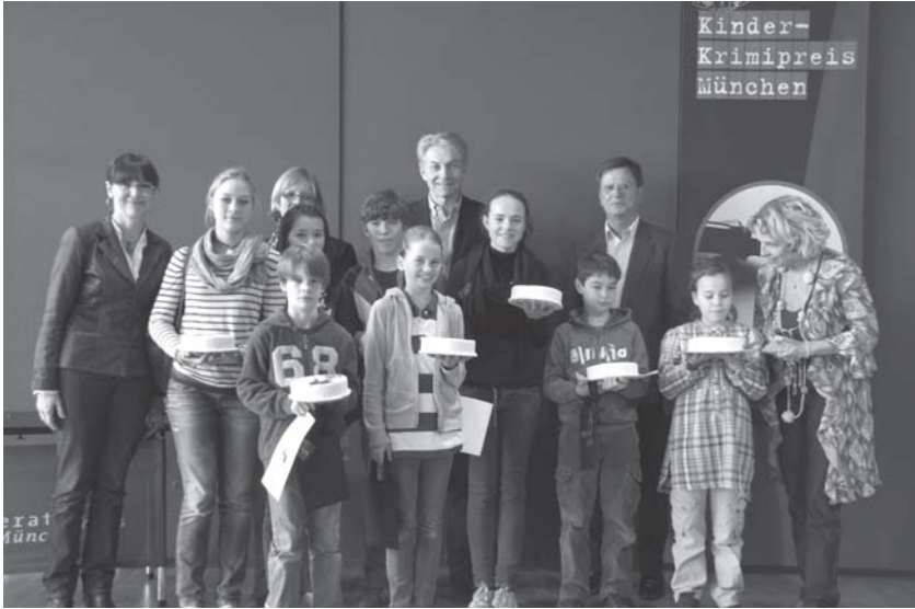
Alle diesjährigen Preisträgerinnen und Preisträger