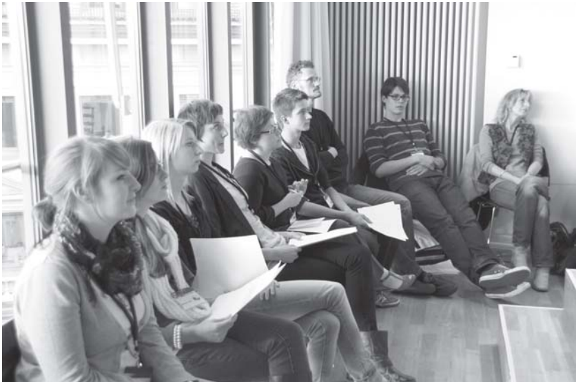
Die Krimijury bei der Preisverleihung