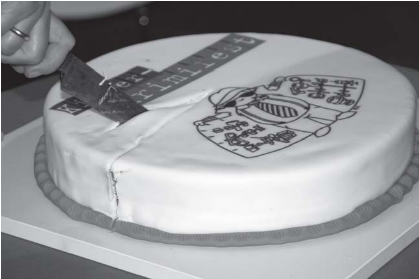
Mit der Tatwaffe eine Torte anschneiden, das gibt es nur beim Kinder-Krimifest